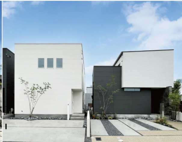
マチかど展示場「清須の家」